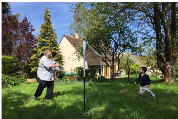
Carte postale 3