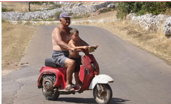
Carte postale 1