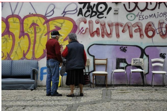
Carte postale 5