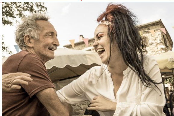
Carte postale 6