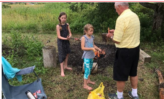
Carte postale 2