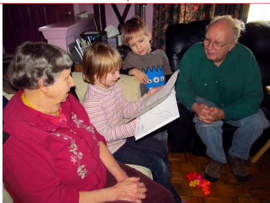
Carte postale 7