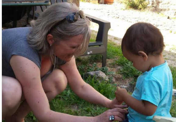
Carte postale 4